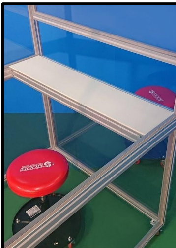
<内側テーブル付き>